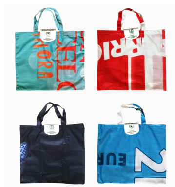
Foto: Taaskasutuskottide tootmine MTÜ-s Töötoad ning taaskasutuskotid.

2014. aastal jätkasime tihedat koostööd AS-ga Postimees, kellelt tellisime reklaami nii nende veebiväljaandes kui ka paberväljaandes.