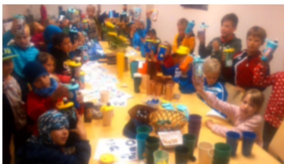
Foto 2. Infopäev õpilastele

Samuti valmis õppevideo pakendi(jäätme)te sorteerimisest, milles külastajaid kutsuti üle pakendite teemal arutlema ning tarku otsuseid tegema. Tutvustav video üleval on sotsiaalmeedias kõigile vaatamiseks ning teavitustöös kasutamiseks (foto 3).